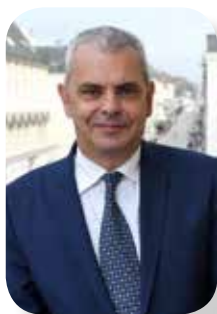
M. Christophe BOUCHET Maire de Tours.