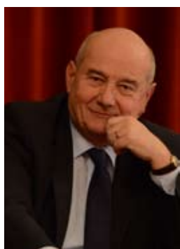
Serge BABARY Maire de Tours.